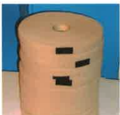
Non-Woven / No-Tejidos