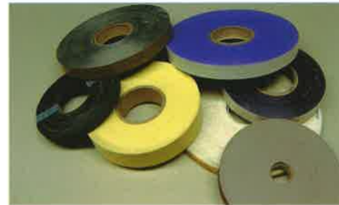
Polymers / Polimeros