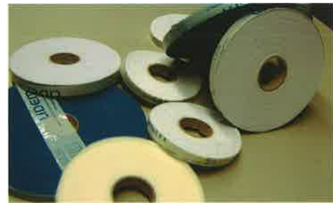
Lingerie / Lencería