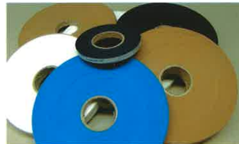
Home Textile / Textil Hogar